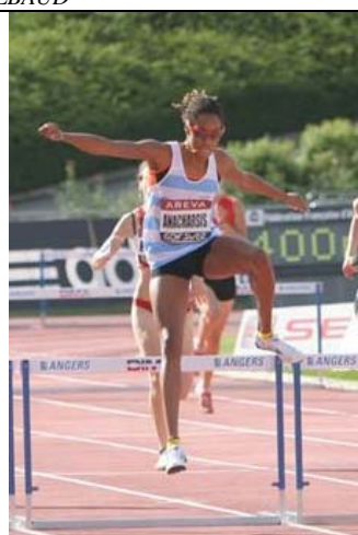
Elle n'a pu donner sa mesure