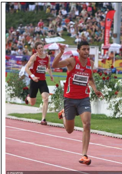
Une belle occasion manquée