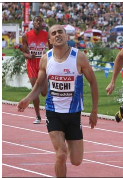
Après 6 podiums, la 1 e victoire